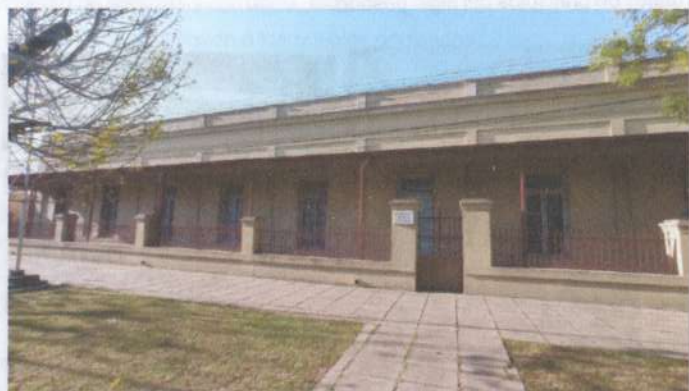
Edificio Escolar N° 2. (Avenida Libertad N° 2182).

El museo incorporó a su patrimonio, desde su creación gran cantidad de documentos y material fotográfico que llevaron a la conformación del Archivo Histórico. Entre ellos se destaca el fondo Archivo Empresa Milesi Hermanos, serie documental inédita, de incalculable valor documental para la historia económica-agraria santafesina, al reunir datos de dicha empresa desde 1871 a 1970. Desde el 2015, la Asociación Amigos del Museo Histórico de la Colonia, trabajó en un proyecto de puesta en valor de dicho acervo, mediante su preservación digital, tarea que fue desarrollada por el C.E.H.I.P.E. 4 entre 2018 y 2021, habiéndose digitalizado 280.000 imágenes, que constituyen un fiel testimonio de nuestro patrimonio histórico cultural, y perfecto reflejo de la evolución de nuestra sociedad entre fines del siglo XIX y principios del siglo XX.