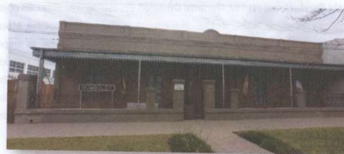
Museo Histórico de la Colonia. Edificio Escolar N° 3. (Avenida General San Martín N° 1625).

En estos edificios, que en sí mismos tienen un enorme valor cultural, hoy son considerados parte de la colección del museo. En ellos se reúne las memorias del proceso de la colonización de Humboldt, como así también de diferentes temas relacionados con nuestro patrimonio histórico – cultural, que permiten apreciar con orgullo la impronta que nuestros abuelos dejaron en nuestra comunidad, el sueño del trabajo y esfuerzo, de construcción colectiva y de bien común.