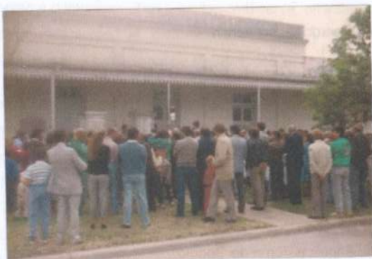
Inauguración del Museo.

Durante más de un año esta comisión trabajó recopilando gran cantidad de objetos y documentos que representarían el origen de nuestra colonia, a los efectos de poder inaugurar el domingo 1° de octubre de 1989, en ocasión de la celebración del 121° aniversario de la fundación de la colonia, el Museo, cuyo edificio, cedido por la Comisión Escolar, fue adaptado para esta misión.