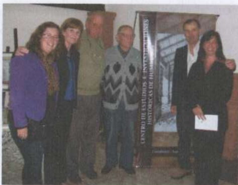
Presentación de la primera publicación del CEIHH.