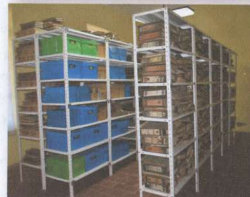
Fondo documental Empresa Milesi.

Además, se cuenta con una pequeña biblioteca, que se inició en 2013. Desde esa fecha aumentó el número de volúmenes en consonancia con el patrimonio museístico. Posee más de un centenar de volúmenes de historia regional y nacional, integrado por libros, revistas, publicaciones, catálogos y folletos, junto con un extenso archivo de fotografías, cuyo acervo actualmente se está inventariando.