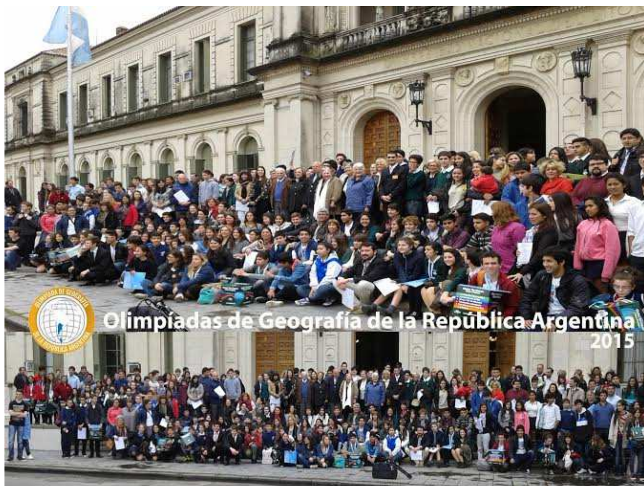
Participantes de la Instancia Nacional en la Olimpiada de Geografía de la República Argentina – Programa Nacional – 2015 en el Paraninfo de la Universidad Nacional del Litoral. Santa Fe de la Vera Cruz, 02 de octubre de 2015. República Argentina.

De un total de 12.080 estudiantes y alrededor de 500 escuelas -donde 178 lo hacían por primera vez- casi 250 estudiantes lograron la habilitación para participar en la Nacional.