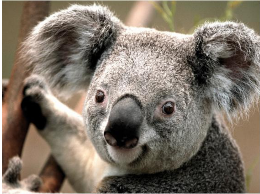
Imagen 1: desarrollo del pié de foto o cita de la fuente.