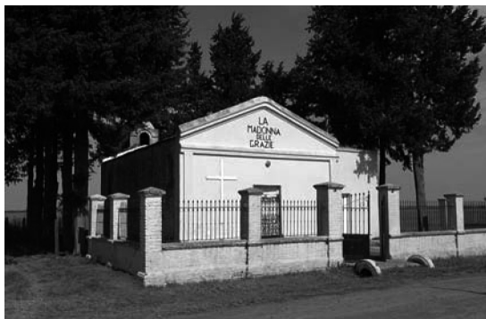
Capilla Nuestra Señora de las Gracias.