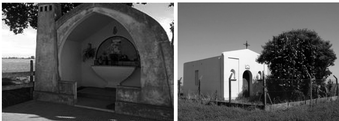
Capilla de Nuestra Señora de los Dolores. Capilla de San Pancrasio.

hasta que aparecía la mejor oferta. Se sabe que esta especie de práctica devocionaria, pero también festiva de fuertes resabios de las Fiestas de los Locos en el Medioevo europeo, podía llegar a durar toda la noche, hasta que todos los presentes habían adquirido la gracia de ser ungidos por el 'birrete' santo.