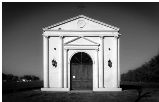
Capilla San Antonio.

trucción tuvo la intención de agradecer al santo por haber salvado sus vidas, colocando una imagen traída desde el Piemonte. La festividad se celebra cada 7 de septiembre.