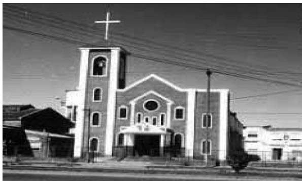
Iglesia Parroquial Nuestra Señora del Tránsito.

búes de colosales proporciones, tenía el tronco ahuecado y una abertura grande, a la que Don Simón colocó una puerta utilizando el interior como dormitorio, en las tardes de verano» (7).