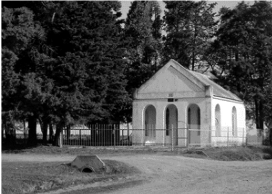
Capilla San Roque.