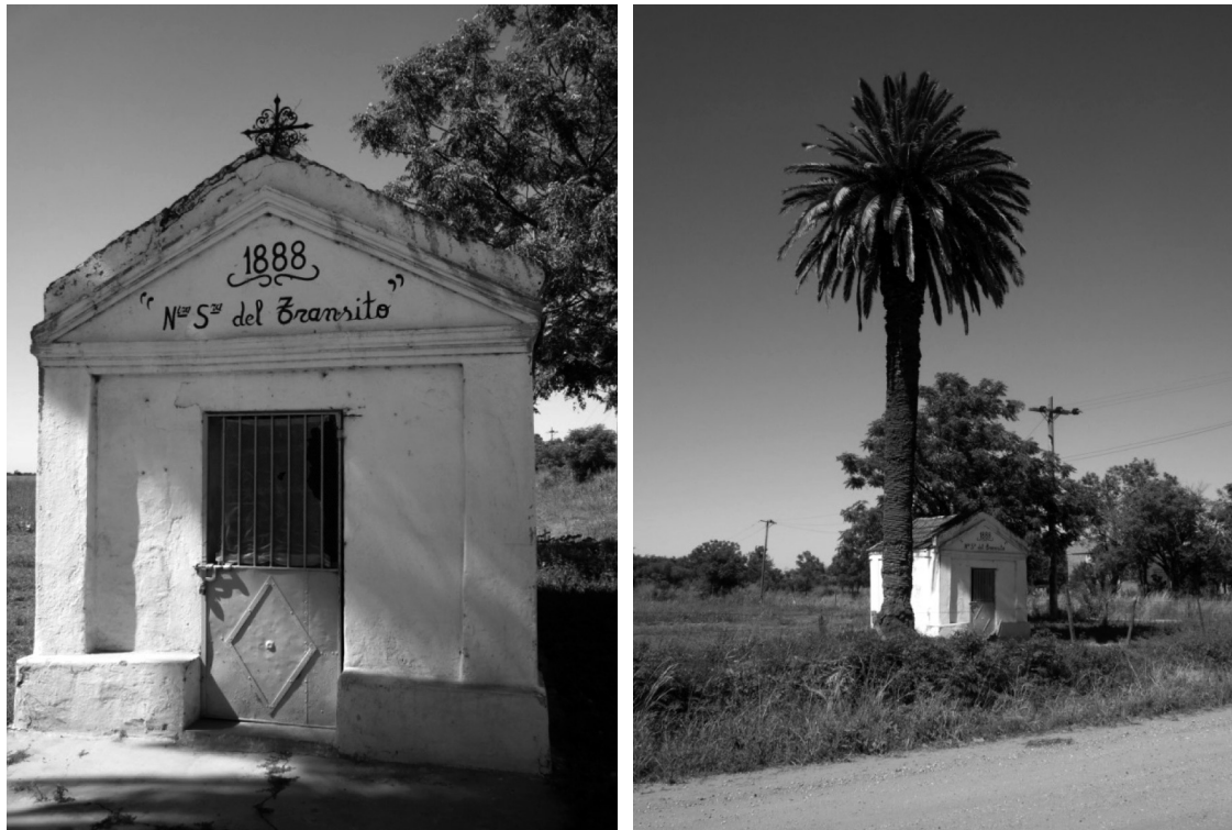
Capilla Nuestra Señora del Tránsito.

Hacia 1880 el gobierno provincial puso en venta campos vírgenes en la localidad de Recreo, a 20 km de la capital provincial, a un precio de $100 la hectárea y pagaderos a largo plazo. Giovanni Domenico y Antonio compran 100 hectáreas cada uno y una vez construidas las viviendas trasladan a sus familias, dedicándose a la siembra de trigo, maíz, lino y alfalfa, colaborando los hijos mayores en las tareas del campo.