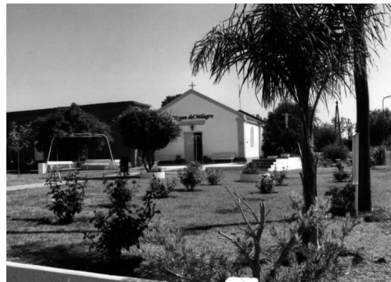
Capilla Nuestra Señora del Milagro.