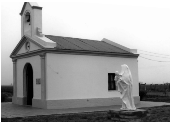
Capilla San Chiaffredo.