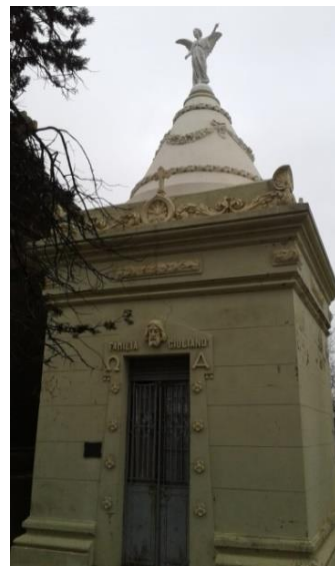
Fotos de mausoleos del cementerio de Plaza San Francisco