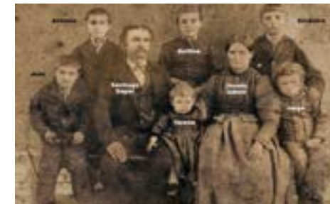
Foto del álbum familiar

Los relatos familiares, sumados a toda documentación que llegaba a mis manos, me movilizó a investigar sobre mis raíces familiares, hasta obtener la ciudadanía italiana. Pero lo que más agradezco es poder conservar tantos recuerdos así como el lazo logrado con familiares de Italia, con quienes nos hemos encontrado oportunamente.