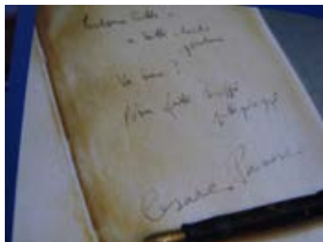
Última página del Diario de Pavese

Para su deleite, una copia de la misma será depositada en la biblioteca de nuestro Centro Piemontés.