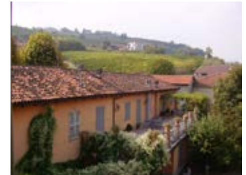
Casa natal de Pavese

Si bien estas solas circunstancias no explican su temprano suicidio un 27 de agosto de 1950 en un hotel de Turín, sirven de coadyuvantes para entender una existencia (como las de muchos artistas suicidas en esa época) marcada por recurrentes crisis depresivas y por el male di vivere , que el arte pavesiano mostrará con notable eficiencia. Cursó estudios en Turín y en 1932 se licenció en Letras con una tesis sobre Walt Whitman. Reflejo de su temprano entusiasmo por la literatura norteamericana y de potentes voces que leyó y tradujo. convencido de poder insuflar al alicaído aire intelectual italiano un poco del vigor del mito americano de los orígenes y de la libertad encarnada en las obras de la democracia. Traduciendo a Melville, Whitman, Stevenson, Sherwood Anderson y otros, Pavese y sus amigos colaboraron en generar una postura intelectual y política que sirvió de contención contra el régimen imperante. Hacia 1930, cuando el fascismo empezaba a ser "la esperanza del mundo", ocurrió que algunos jóvenes italianos descubrieron una Norte-