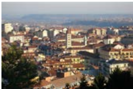
Vista panorámica de la ciudad de Biella

Así lo confirman los hallazgos arquitectónicos que se conservan en el Museo del Territorio de la Edad de Bronce. La primeras noticias de la antigua Buguella se remontan a un documento del 826. Dominada por los obispos de Vercelli, en 1379 pasó a manos de los Saboya. Durante el siglo XIX Biella experimentó un gran desarrollo industrial, fundamentalmente en la industria textil.