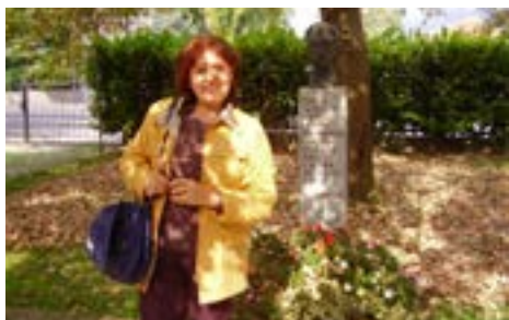
Estatua celebratoria en el jardín de la casa natal