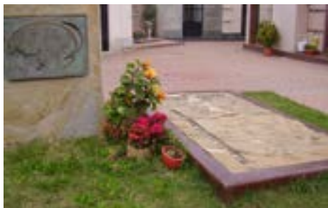
Tumba de Pavese en Santo Stefano Belbo