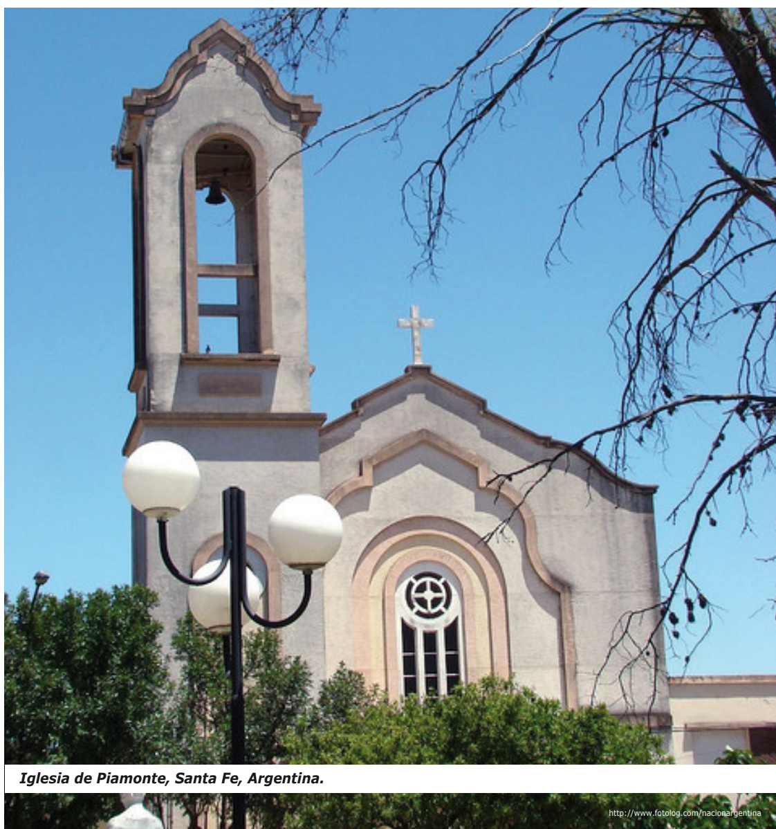
Iglesia de Piamonte, Santa Fe, Argentina.