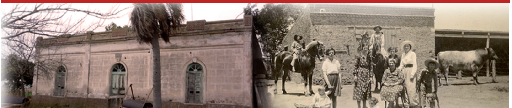
La Pampa Gringa - Departamento Castellanos