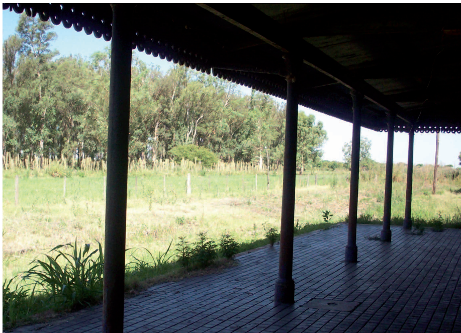
Antigua Estación del Tren de Garibaldi.