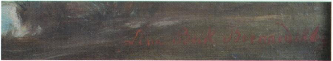
Paisaje de Santa Fe / Detalle firma Lina Beck (Col. Privada)