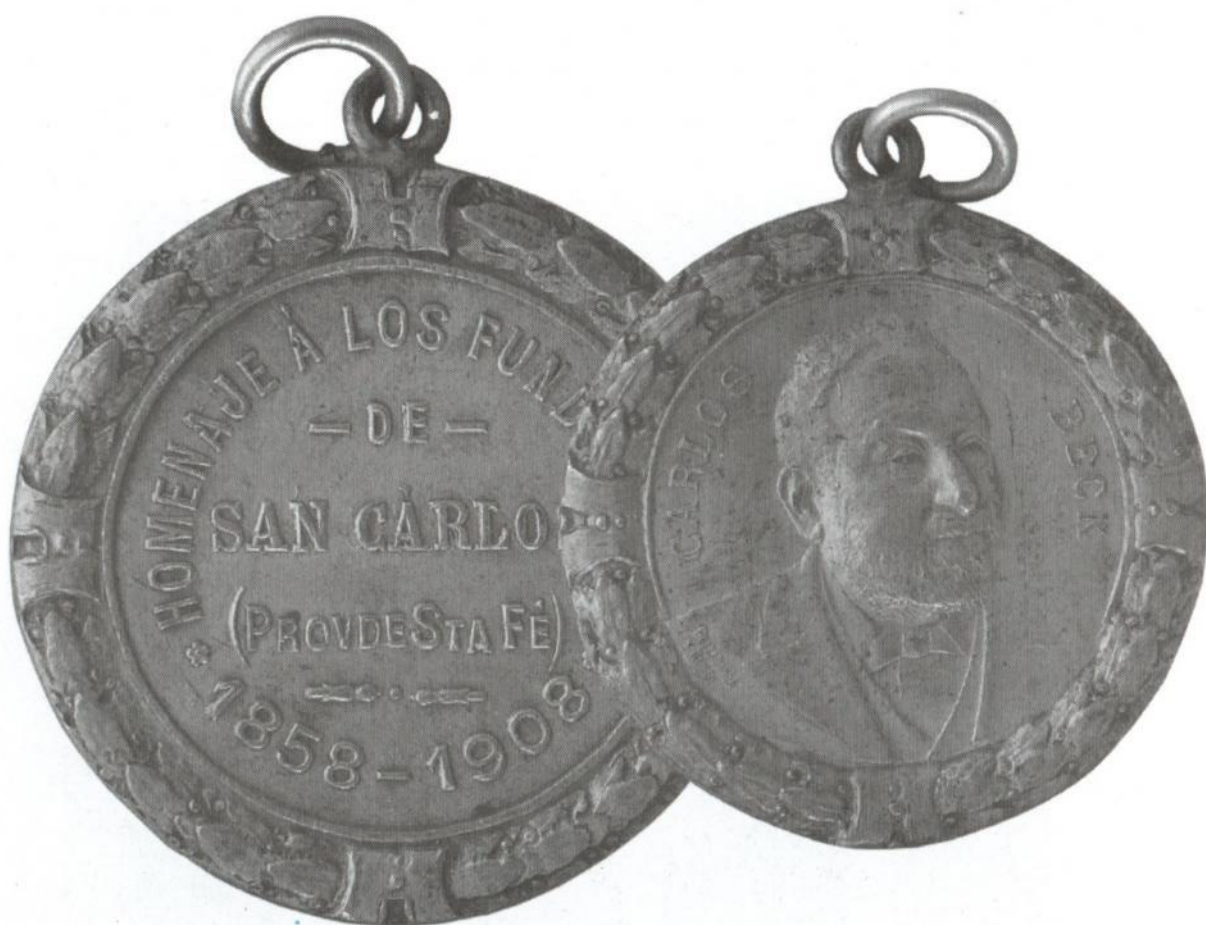
Medalla otorgada a descendientes del fundador de San Carlos