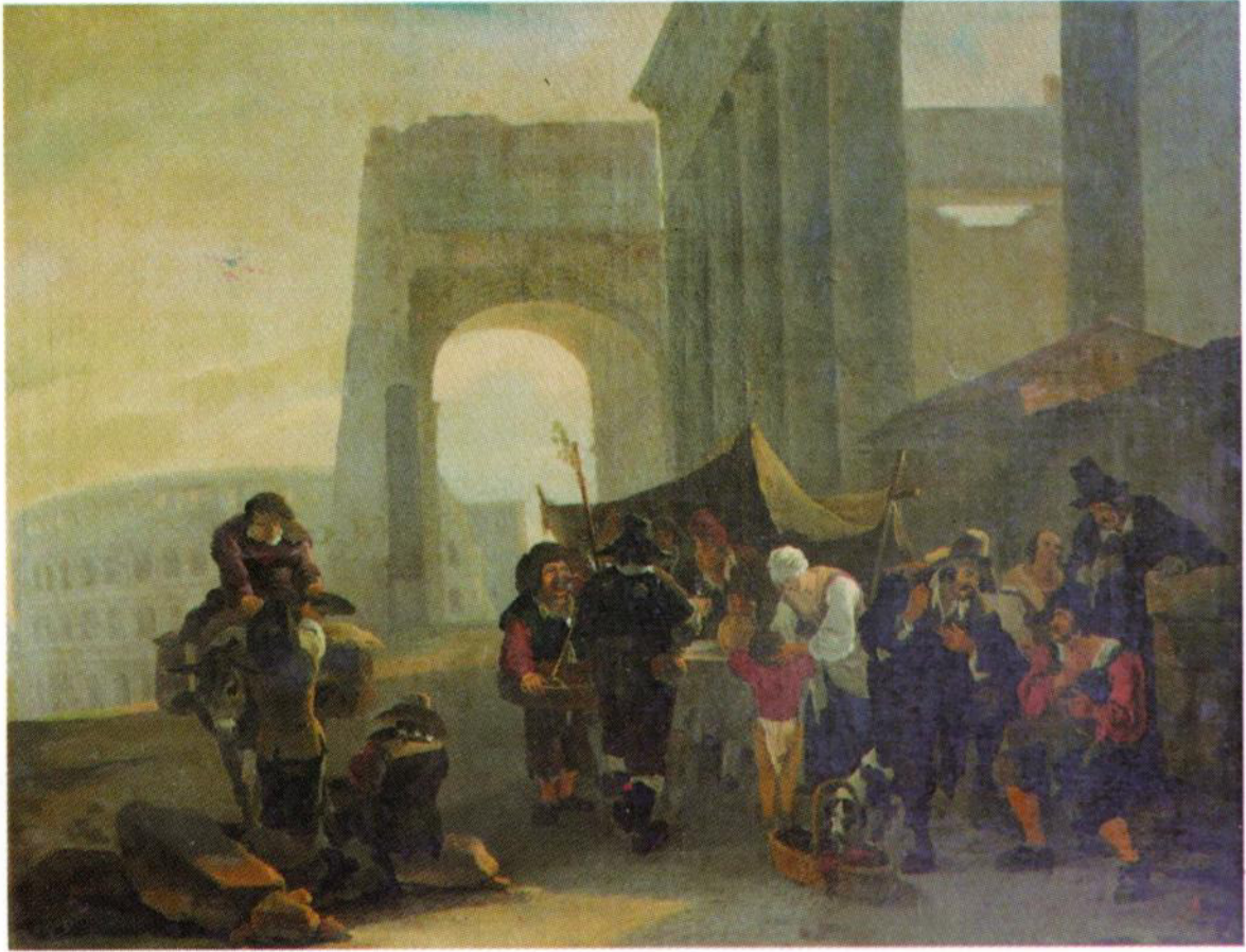
Escena romana (Col. Privada)