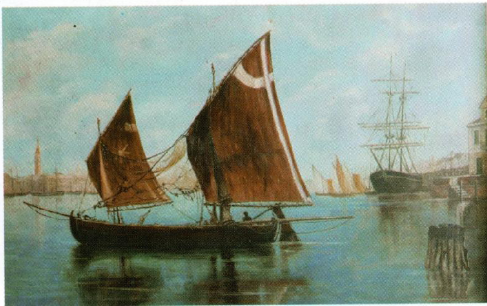
Paisajes venecianos Sin fecha (Col. Privada)