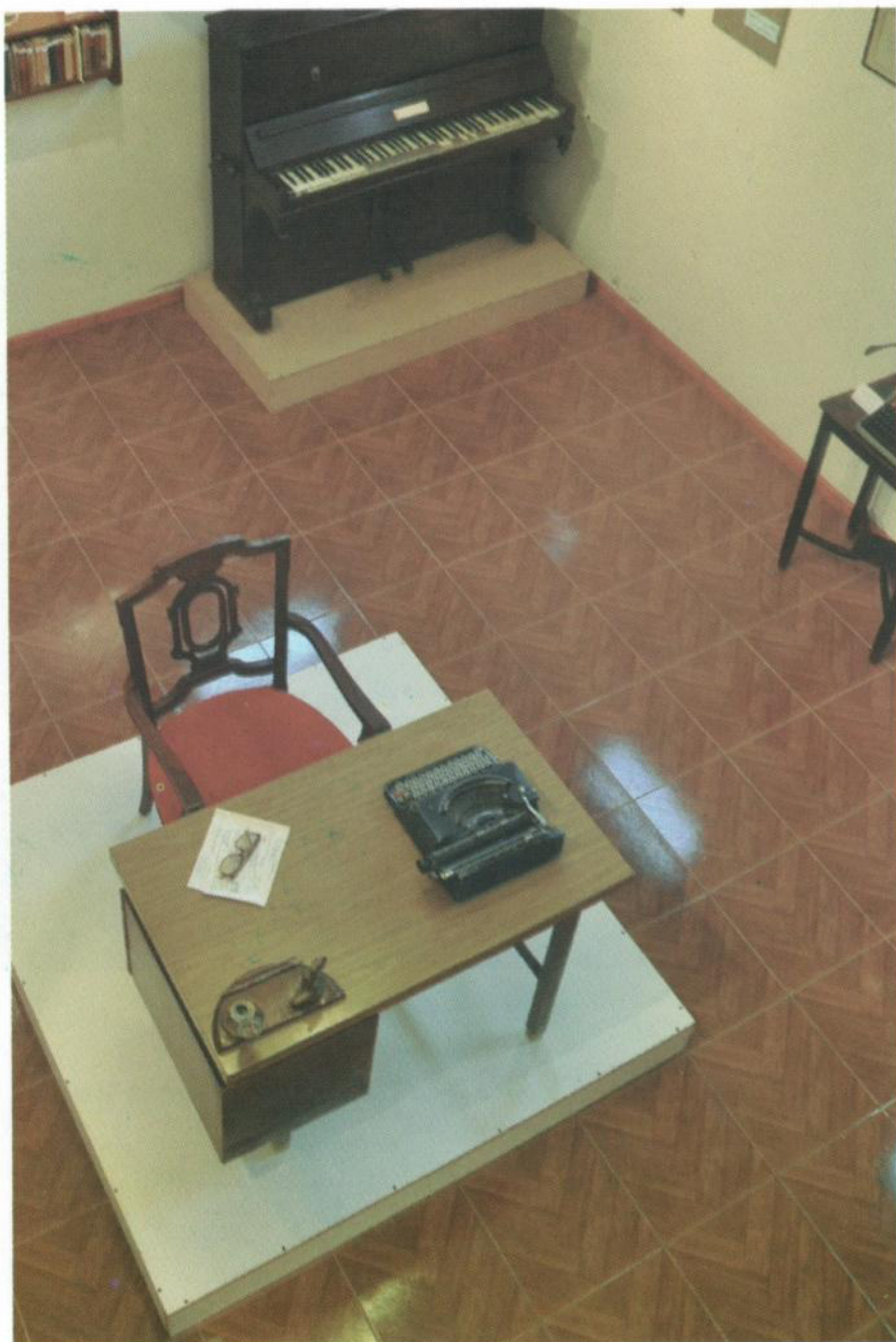
Piano que Lina usó durante su estancia en Santa Fe Museo Pedroniano de San Carlos Norte en préstamo del Museo Histórico de Santa Fe