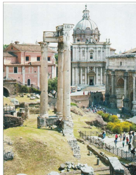
Espacio cívico. Roma, Italia Las grandes ciudades requieren un centro donde los ciudadanos se reúnan, interactúen, hagan sus negocios e intercambien ideas. El Foro, corazón de la antigua Roma, sentó los estándares de los espacios públicos posteriores. Donde ahora camina los turistas entre ruinas, alguna vez hubo un espacio vital con tribunales, templos, monumentos y mercados que prosperaron por más de 1.000 años.