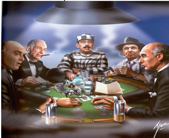
Revista Caras y Caretas , Buenos Aires, marzo 2006.

a) ¿Qué te sugiere la imagen anterior? ¿Por qué aparecen